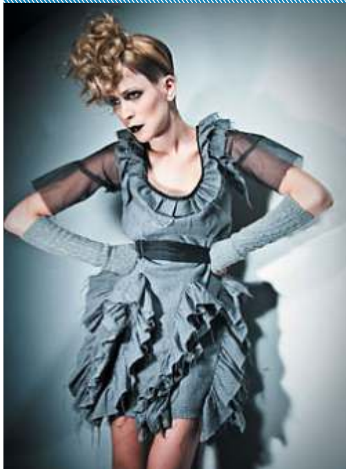
Imágenes: diseños de empresas socias de la CDU bajo el rubro textil/indumentaria tomadas del catálogo CDU y proyectos en el marco del Conglomerado de Diseño de Uruguay.