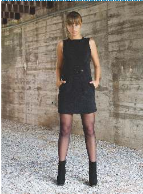
Imágenes: diseños de empresas socias de la CDU bajo el rubro textil/indumentaria tomadas del catálogo CDU y proyectos en el marco del Conglomerado de Diseño de Uruguay.