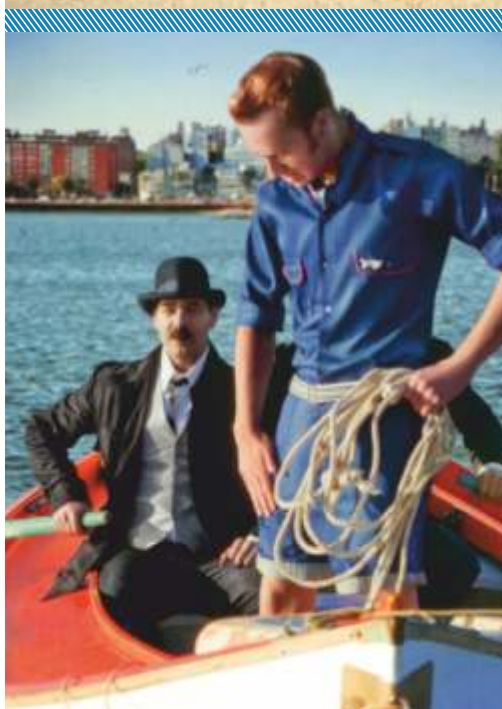
Imágenes: diseños de empresas socias de la CDU bajo el rubro textil/indumentaria tomadas del catálogo CDU y proyectos en el marco del Conglomerado de Diseño de Uruguay.