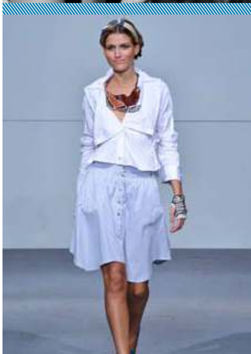
Imágenes: diseños de empresas socias de la CDU bajo el rubro textil/indumentaria tomadas del catálogo CDU y proyectos en el marco del Conglomerado de Diseño de Uruguay.