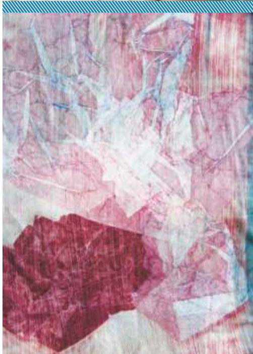
Imágenes: diseños de empresas socias de la CDU bajo el rubro textil/indumentaria tomadas del catálogo CDU y proyectos en el marco del Conglomerado de Diseño de Uruguay.