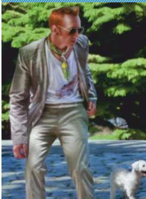
Imágenes: diseños de empresas socias de la CDU bajo el rubro textil/indumentaria tomadas del catálogo CDU y proyectos en el marco del Conglomerado de Diseño de Uruguay.