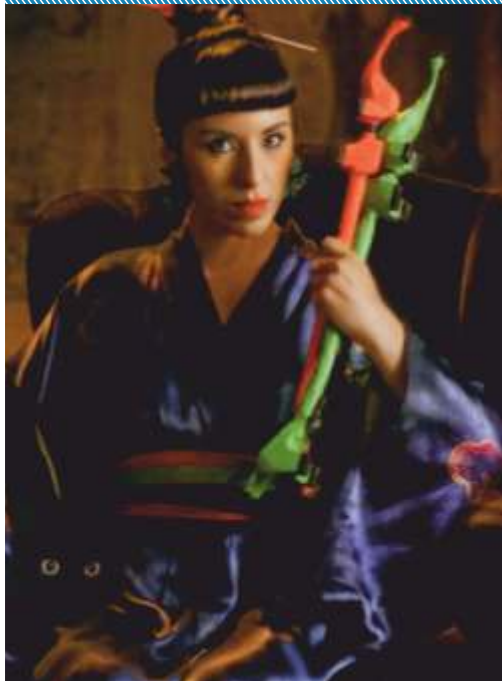
Imágenes: diseños de empresas socias de la CDU bajo el rubro textil/indumentaria tomadas del catálogo CDU y proyectos en el marco del Conglomerado de Diseño de Uruguay.